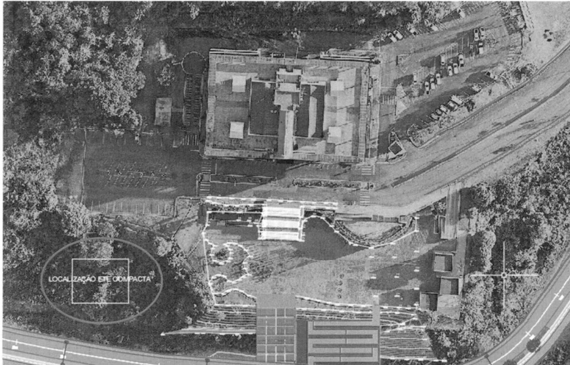
Figura 3 – Localização da ETE compacta.

Além da instalação da ETE compacta, vale ressaltar que a presente contratação viabilizará ainda a realização de alguns serviços complementares, tais como a construção de um poço e de um reservatório de água, também para atendimento da demanda dos quiosques do Parque Urbano; e a construção de uma fossa séptica para recepção e tratamento dos efluentes dos quiosques da praça T3, os quais por estarem em uma cota topográfica inferior à da ETE que será implantada não poderiam ser por ela atendidos.