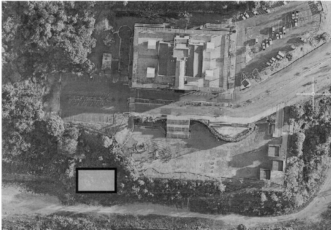
Figura 2 - Localização da ETE Compacta