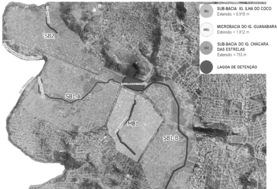
Figura 1 - Áreas de intervenção do Programa.

Neste momento, encontram-se em execução as obras da Primeira Etapa, que compreendem a Lagoa de Detenção e a sub-bacia SB1-A, de acordo com a Figura 01. Na Figura 2, a seguir, podemos observar com maiores detalhes parte do Parque Urbano da Lagoa e a localização do prédio da Prefeitura Municipal de Parauapebas. Atualmente, o esgoto coletado no prédio é direcionado para uma fossa séptica, a qual recebe manutenções frequentes por parte da autarquia municipal.